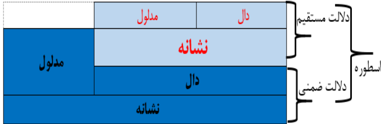
شکل (۲): سطوح نشانه‌شناختی اسطوره

بدین ترتیب، بارت با افزودن سطح دوم دلالت، نشانه را نه تنها حامل معنای صریح، بلکه حامل معنای ضمنی و اسطوره‌ای می‌داند؛ معنای‌ای که در بستر فرهنگ و گفتمان اجتماعی شکل می‌گیرند.