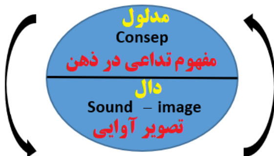
شکل (۱): نشانه در رویکرد سوسور (سوسور، ۲۰۱۱: ۶۵)

در یک نشانه، دال و مدلول از یکدیگر جدایی‌پذیر نیستند و رابطه میان آنها — یعنی دلالت- قراردادی یا عرفی است، نه طبیعی و از پیش تعیین شده. دال‌ها رابطه‌ای منطقی و ذاتی با مفاهیمی (مدلول‌ها) که به ذهن متبادر می‌کنند ندارند، بلکه این رابطه بر اساس توافق و قراردادهای زبانی و فرهنگی شکل می‌گیرد.